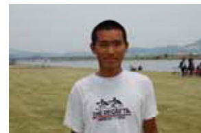
178 cm 68 kg 「ONE for ALL ALL for ONE」