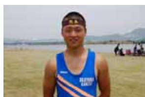
178 cm 75 kg 「もう負けられねえ！」