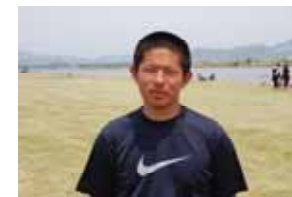
168 cm 74 kg 「チームでの日本一 !!」

現在部員は3年生10名・2年生12名・1年生10名でがんばっています。 ( 森川先生曰く:「1年生部員大募集中」 )