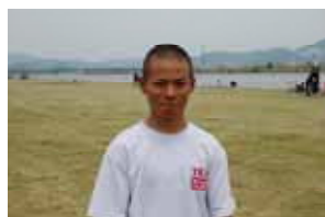
157 cm 48 kg 「日本一になる」