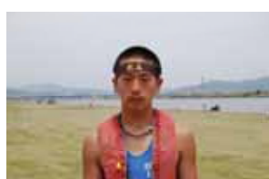
175 cm 70 kg 「国体7連覇する！」