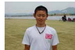
168 cm 57 kg 「チーム浅野で日本一を 目指せるようがんばる」