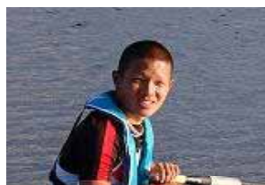
177 cm 68 kg 「国体7連覇 !! 日本一 !!」