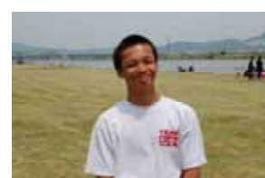
166 cm 58 kg 「今度こそ... 飛びます 魅せます」