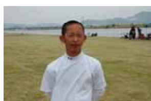
163 cm 49 kg 「もう負けられない...」