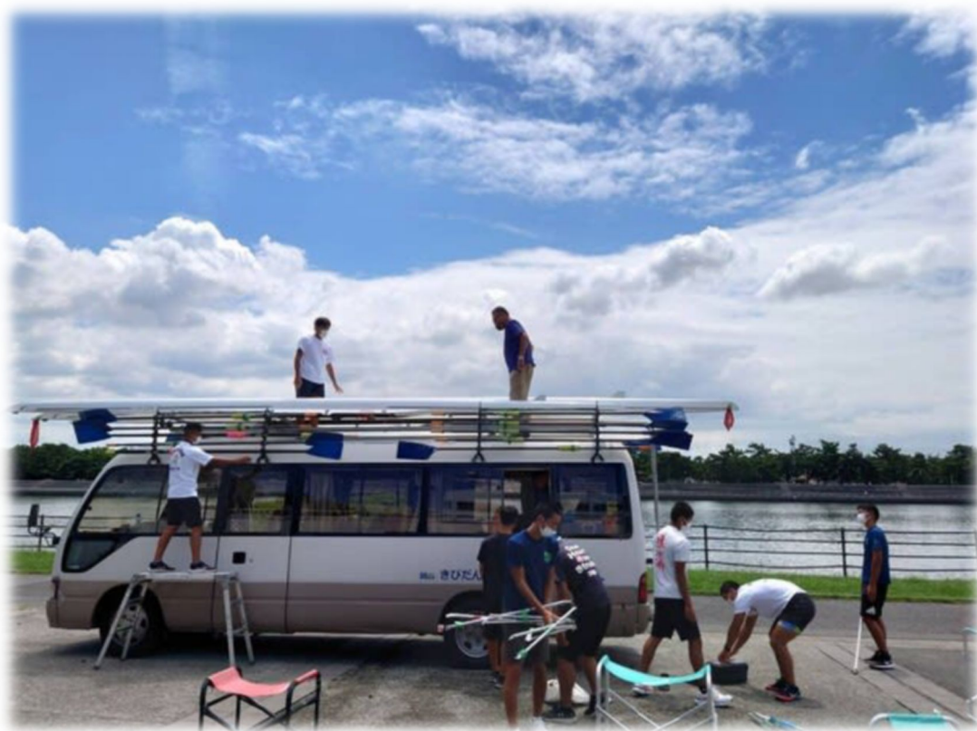
夏の浜寺・・・秘密の合宿風景