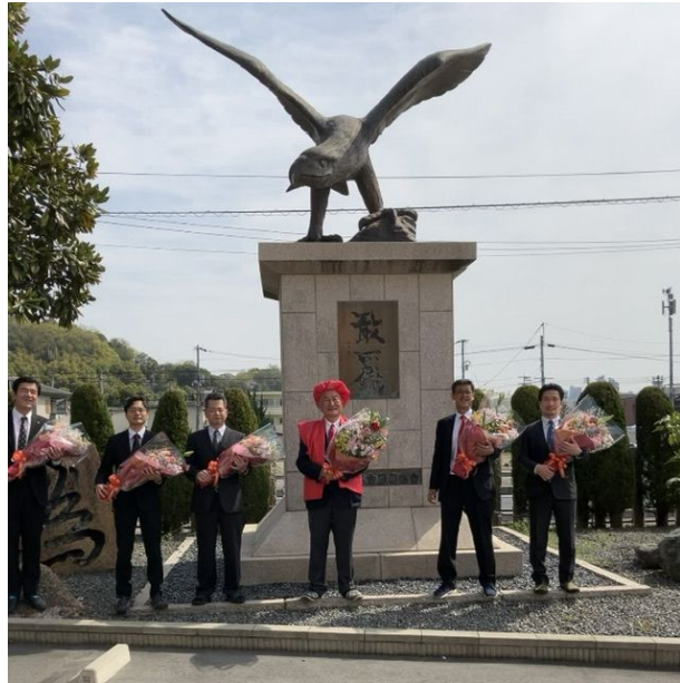
センターを取っちゃう所は流石です!!