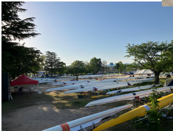
食べたアカンやつじゃん。→