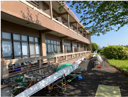
ゴール先の艇置き場ではなく 青年会館の栈橋から出艇します