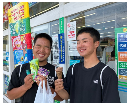
本来なら此処に置いて、此処から出艇 唐橋公園

5月5日、今日はスパーッと勝って決勝に進んでしまえ!!って感じで朝から琵琶湖へ。 あっそうそう、大津の東横インには岡大のチームが泊ってましたよ。スポーツ関係ではど こぞの弓道部が長い弓を抱えて自動ドアにぶつかる事無く通って行きます。凄いねえ